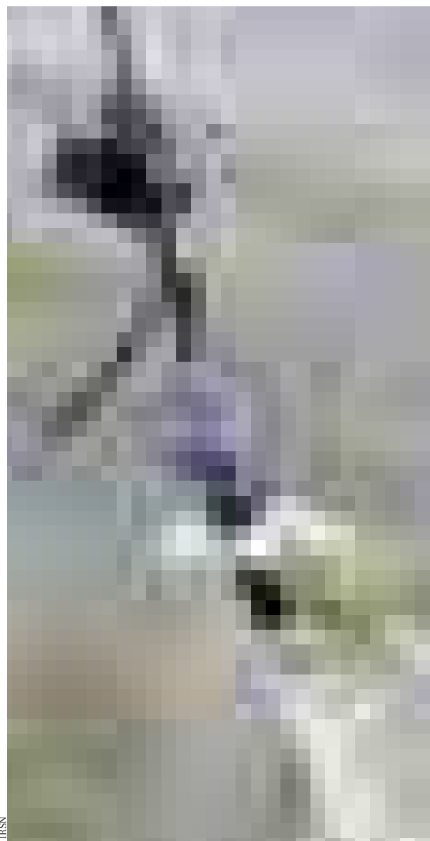
▲ La sonde Téléhydro de l'IRSN permet de mesurer, sur site et en continu, les radionucléides.

Autre difficulté : les portiques des CET ne sont